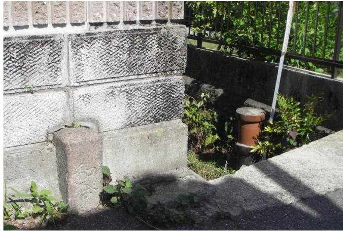
左手の小さな石柱に「和合橋」とあります。

す。私は60年以上も通っていたのに、気づかなかったのですが、「ぶらくわな」で仲間から教えられました。今では小さな溝ですが、昔は立派な水路であり、橋が架かっていたと思います。命名された橋としては日本では最小であり、若しかすると世界でも珍しく、ギネス級かもしれません。